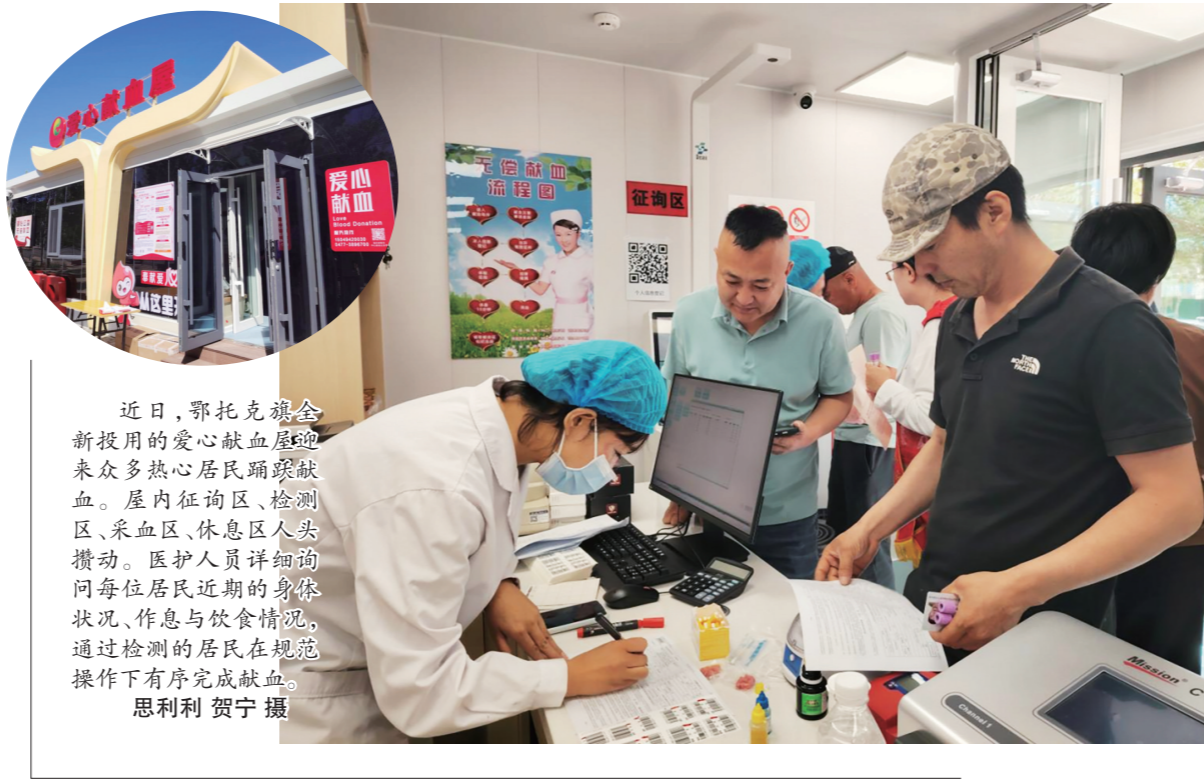
近日,鄂托克旗全新投用的爱心献血屋迎来众多热心居民踊跃献血。屋内征询区、检测区、采血区、休息区人头攒动。医护人员详细询问每位居民近期的身体状况、作息与饮食情况,通过检测有序完成献血。

新时代新征程,科技迭代永不停歇,产业升级永无止境,能力提升永远在路上。领导干部既要讲政治家的胸怀和眼光,也要有科学家的严谨和专业。只有真正做到知科技、懂产业、善决策,才能在未来的激烈竞争中抢占先机、在推动高质量发展中展现更大作为,不负时代重托、不负人民期望。(转自《学习时报》)