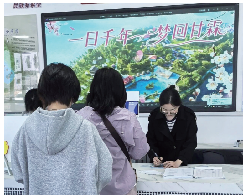
近日,在我市一家旅游景区,游客自觉排队、互相礼让,工作人员耐心引导、热情接待,共同营造文明和谐的出游环境,让暖城鄂尔多斯因文明而温暖。乌轩摄

快乐出游,文明不放假。然而,在节假日出游高峰期,仍有个别游客贪图方便随意停车,扰乱了交通秩序,拉低了城市颜值,有损市容市貌。在此曝光不文明行为,提醒大家自觉规范停车、恪守文明底线,共建安全畅通、文明有序的出游环境。乌轩摄