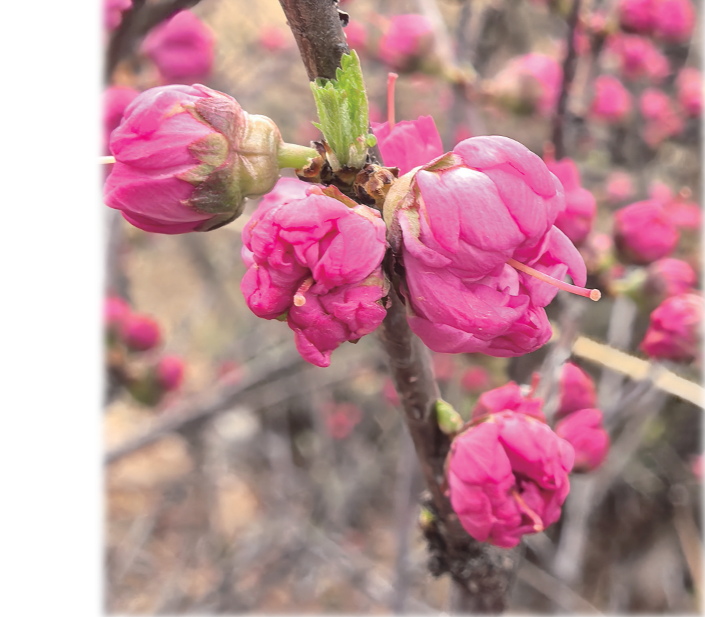
含苞欲放