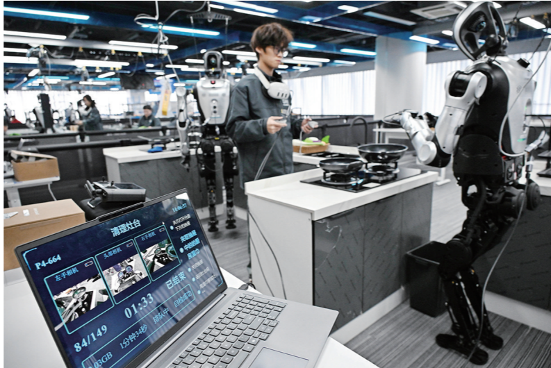
2026年3月23日，在山东省青岛市市南区机器人数据采集训练场，训练师在居家收纳场景内指导机器人进行训练。

“当前，要深化拓展‘人工智能+’，促进新一代智能终端和智能体加快推广，培育智能原生新业态新模式。同时，要统筹发展和安全，构建