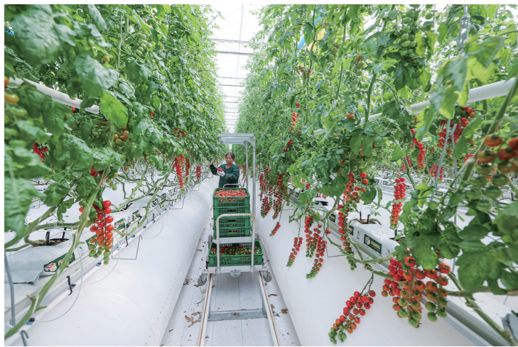
2026年4月15日，村民在位于浙江省宁波市黄湾镇的浙江光禾智谷生态农业有限公司玻璃温室内采摘番茄。

“十五五”开局之年，做好经济工作至关重要。中共中央政治局4月28日召开会议，分析研究当前经济形势和经济工作，强调“以更大力度和更实举措抓好经济工作”“增强经济发展内生动力”，并作出系列重要部署，为进一步坚定发展信心、牢牢把握发展主动、努力实现“十五五”良好开局指明前进方向。