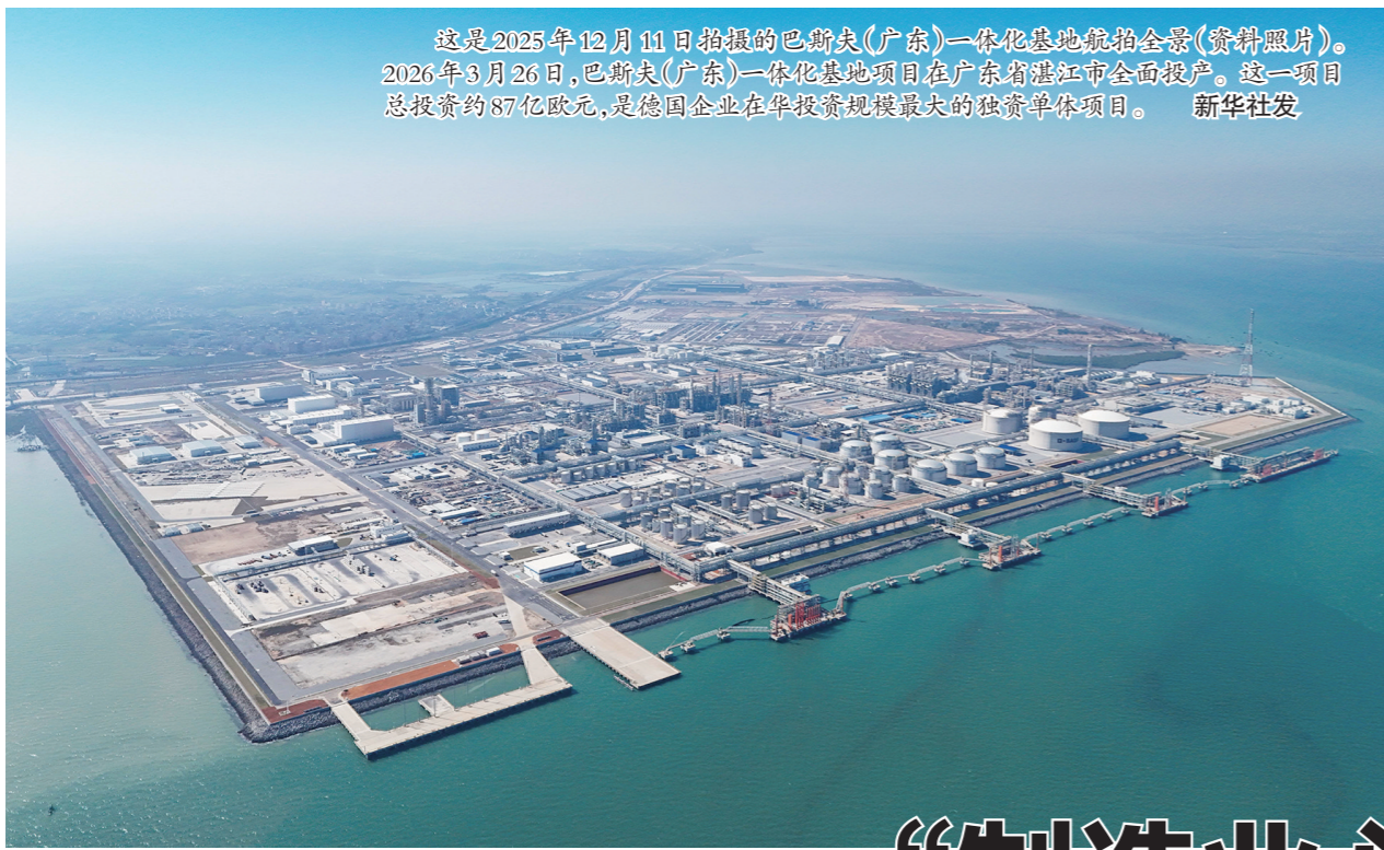
这是2025年12月11日拍摄的巴斯夫(广东)一体化基地航拍全景(资料照片)。2026年3月26日,巴斯夫(广东)一体化基地项目在广东省湛江市全面投产。这一项目总投资约87亿欧元,是德国企业在华投资规模最大的独资单体项目。