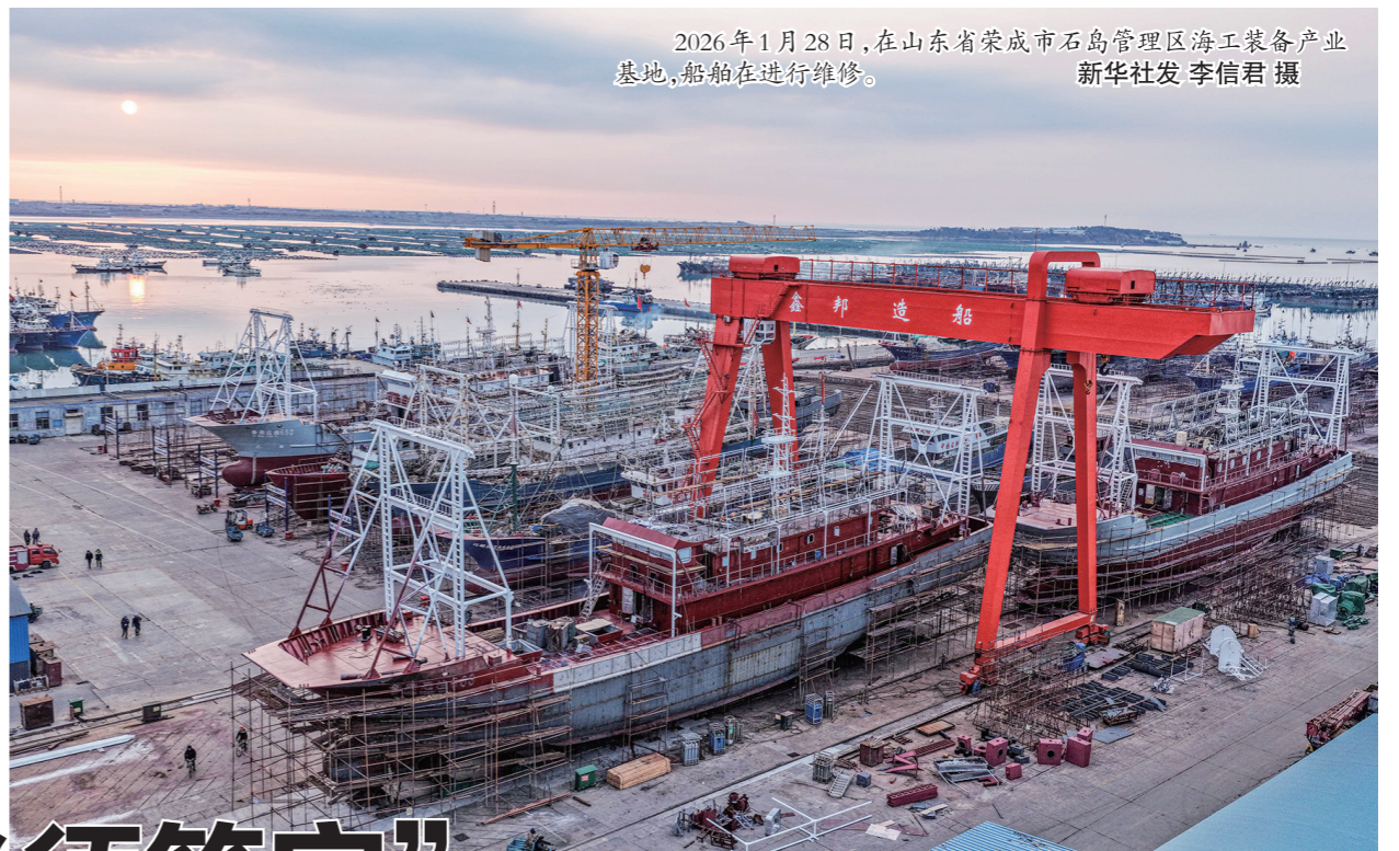
2026年1月28日,在山东省荣成市石岛管理区海工装备产业基地,船舶在进行维修。