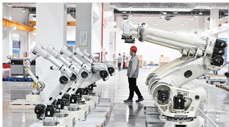
2026年3月17日,在位于南京市江宁开发区的汇川技术南京基地生产车间拍摄的机器人产品。近年来,江苏省将具身智能机器人纳入未来产业重点布局,在南京、苏州、无锡等多地建设具身智能机器人创新中心、数据采集训练中心,成立江苏省具身智能机器人产业联盟,为产业发展提供核心支撑。

湖南“十五五”规划纲要提出,滚动实施先进制造业高地标志性工程;上海“十五五”规划纲要明确,打响“上海制造”品牌;重庆“十五五”规划纲要要求,高质量建设