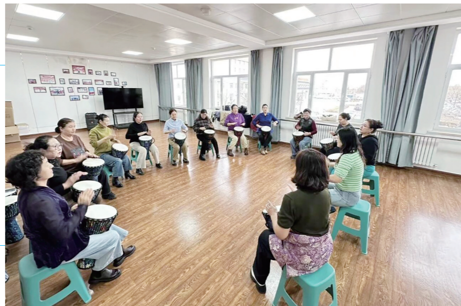
近日，乌审旗老年大学的非洲鼓课堂上，学习氛围热烈，学员们跟随老师的节拍敲击演奏，感受着器乐带来的活力与快乐。

动态评价，助年轻干部“滴灌培养”。系统突破静态名册管理，设立“育才拔俊”动态模块，对优秀年轻干部实行导师评价与组织评价相结合的“双轨评价”机制，每半年进行一次动态评价。依据A、B、C评级结果，系统自动关联培训资源库，定向推送理论课程和实践锻炼建议，变“千人一面”为“一人一策”。针对系统识别出的能力短板，组织上精准安排排训锻炼、驻村历练、项目一线磨砺等补短赋能措施，实现干部成长全程跟踪、培养措施有的放矢。目前，已有320余名年轻干部纳入系统跟踪培养，70余人根据系统建议精准补齐经验短板，推动干部管理从“事务管理”向“人才发展”深度延伸。