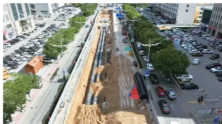
老旧小区“三网”改造。