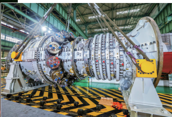
这是300兆瓦级F级重型燃气轮机。