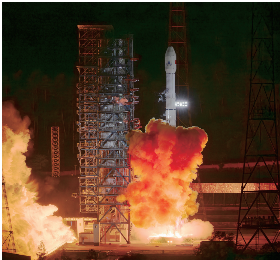
新华社记者 胡喆 温竞华 刘祯