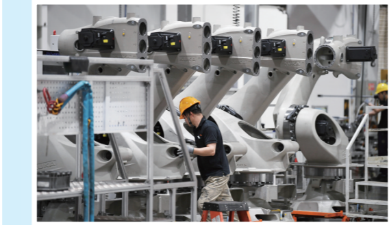
2025年3月25日在广东佛山市美的库卡智能制造科技园拍摄的工业机器人产线车间。