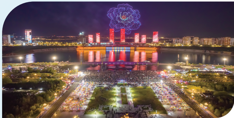
无人机编队表演“牡丹花”在空中“绽放”。