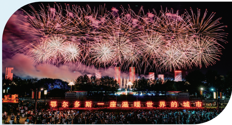
康巴什区“暖城三件套”。