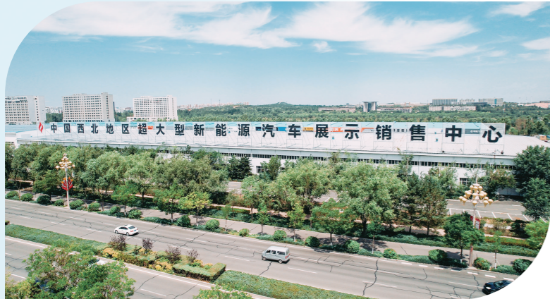
中国西北地区超大型新能源汽车展示销售中心。