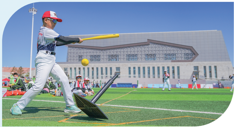
“美好教育”——体育竞技。

2025年8月，连接康巴什区与鄂尔多斯机场的无人驾驶专线顺利试运营，22公里线路串联起文化艺术中心、鄂尔多斯站等关键节点。如今，自动驾驶接驳车、出租车、无人配送车等全面覆盖6大生活场景，让城市科技感尽显。卡动力公司获批智能网联重卡无人商业化运营，全市部署400辆无人驾驶重卡，运营里程突破3000万公里，实现鄂包干线自动驾驶重卡区域互联互通。