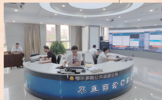
鄂尔多斯市公共资源交易中心不见面开标大厅。