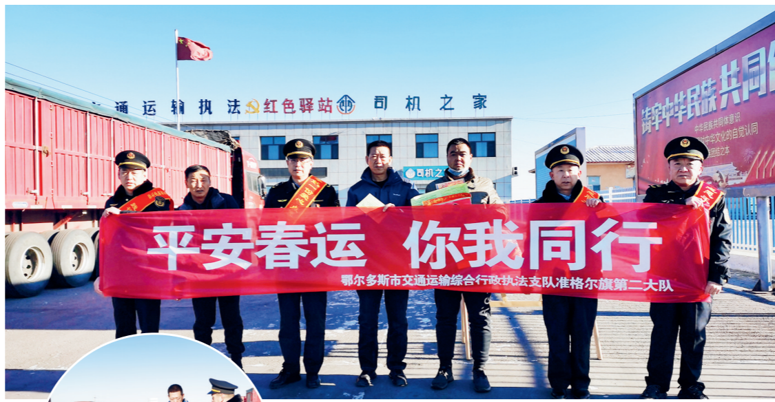
2025年春运启动。近日,鄂尔多斯市交通运输综合行政执法队准格尔旗第二大队的党员志愿者佩戴党徽、亮明身份、争做先锋、树立榜样,在辖区内的暖水司机之家红色驿站耐心地给过往的货车司机提供答疑解惑、热水供应、交通指引、信息咨询等服务,并进行安全保畅宣传。

风腐同查同治既是破解作风顽疾的重要手段,也是铲除腐败滋生的土壤和条件的必要措施。风腐同查同治,就是要把查和治有效贯通起来,形成办案、治理、监督、教育的闭环,阻断风腐问题根源,实现标本兼治。以“查”“治”贯通阻断风腐演变,既“由风查腐”深入挖掘线索,又“由腐纠风”实现双向突破,不断健全完善风腐同查同治工作机制,必将积小胜为大胜,持续释放治理作风问题和惩治腐败的综合效能,一体推进正风肃纪反腐向纵深发展。(转自《学习时报》)